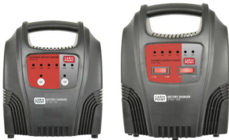
4A + 6A